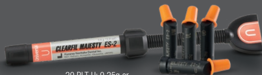
20 PLT U: 0.25g or Syringe U: 2,0ml (3,6g)

PĒRC 4 CLEARFIL MAJESTY™ ES-2 Universal IEGŪSTI 1 CLEARFIL MAJESTY™ ES-2 Universal