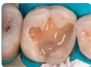
everX Flow aplikācija (dentīna krāsa)