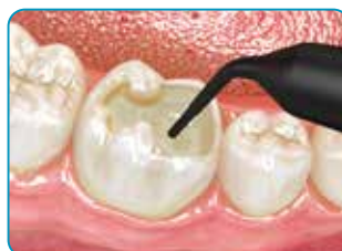
Aizpildiet kavitāti ar everX Flow