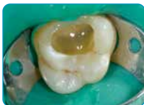
everX Flow aplikācija (Bulk krāsa)