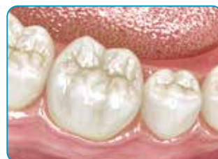
Gala rezultāts, pēdējā slāņa atjaunošanai izmantojot standarta kompozītmateriālu