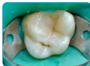
Pēdējais slānis ar G-enial Universal Injectable (A3 krāsa)