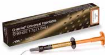
G-aenial Universal Injectable Augstas izturības injekcijas konsistences kompozīts