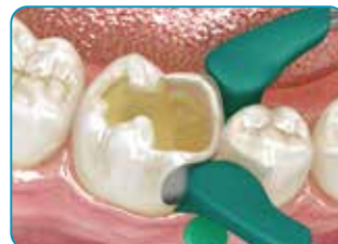
II klases kavitātē vispirms ar standarta kompozītmateriālu atjaunojiet trūkstošo sienu