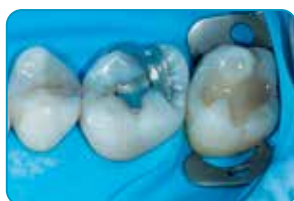
Autors Dr Javier Tapia Guadix, Spānija

everX Flow, pateicoties optimālām tiksotropām spējām palīdz izvairīties no poru veidošanās, tas viegli adaptējas jebkuras formas preparācijai. Tā kontrolētā plūstamība neveido notecējumus un ļauj veiksmīgi to izmantot augšžokļa molāros.