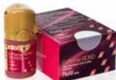
G-Premio BOND Universālais adhezīvs