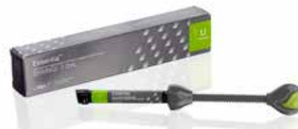
Essentia Universal Universāls pastas konsistences kompozīts

everX Flow, Essentia, G-Premio BOND un G-aenial Universal Injectable ir GC tirdzniecības zīmes. Filtek Bulk Fill Flowable, SDR flow+ un Tetric EvoFlow Bulk Fill nav GC tirdzniecības zīmes.