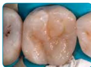
Pēdējais slānis ar Essentia (universālā krāsa)